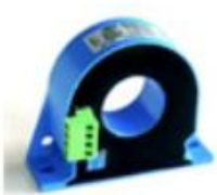
11 12 14