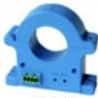
42 43 44